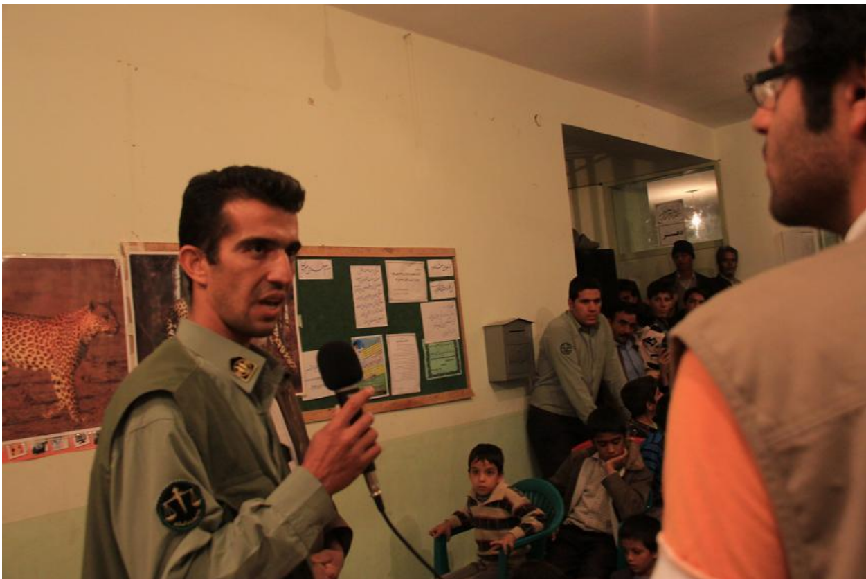
گفتگو با آقای حلوانی و ارائه توضیحاتی توسط ایشان