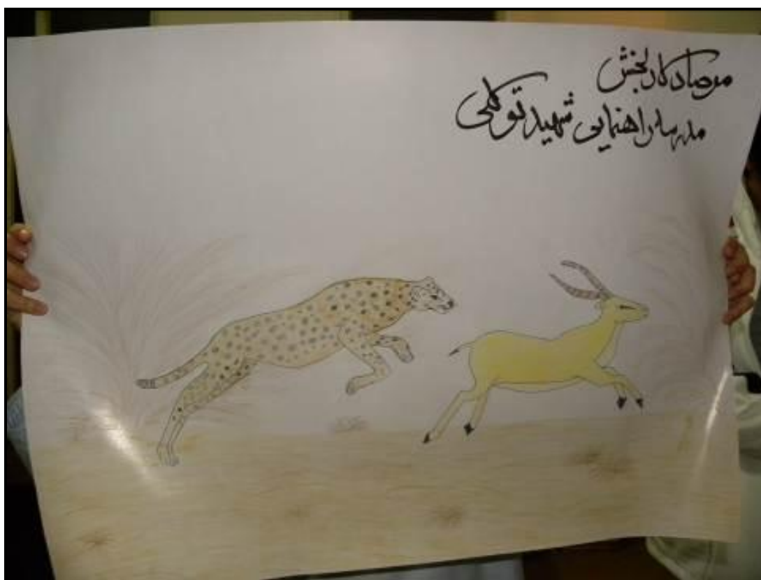
نمونه‌ای از نقاشی‌های دانش‌آموزان با موضوع یوزپلنگ