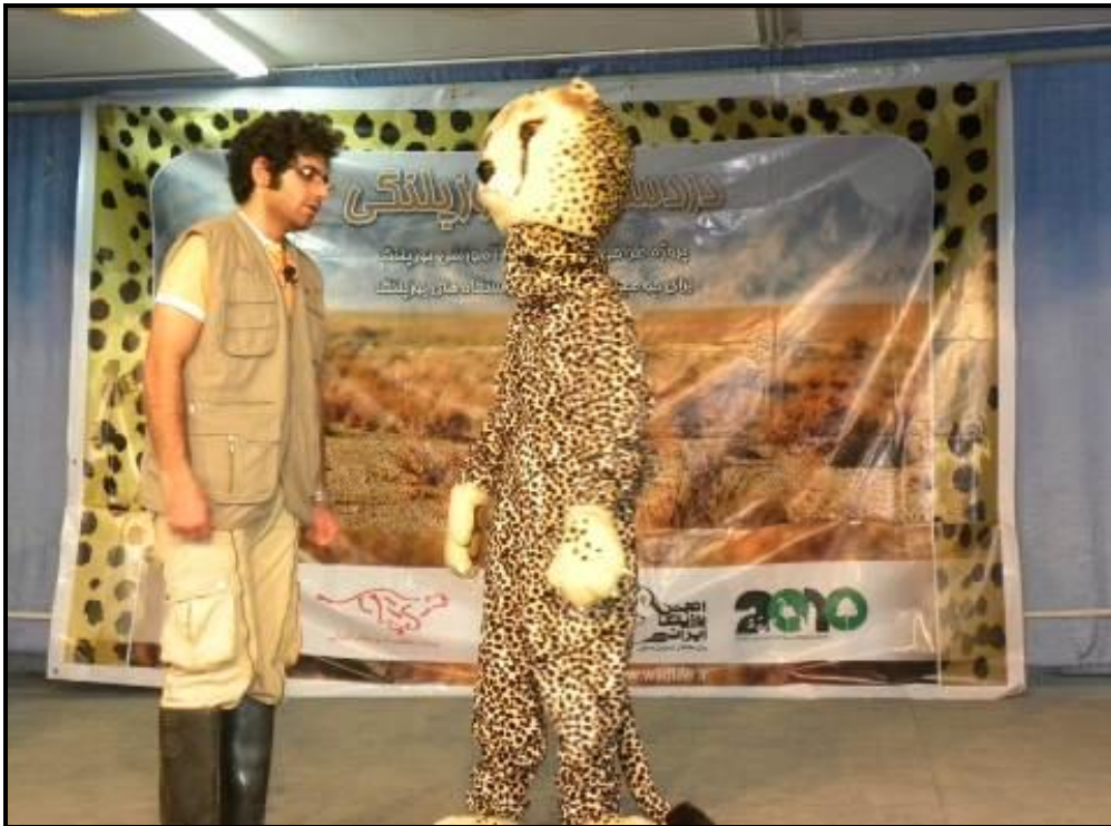
اجرای نمایش در سالن فرمانداری راور