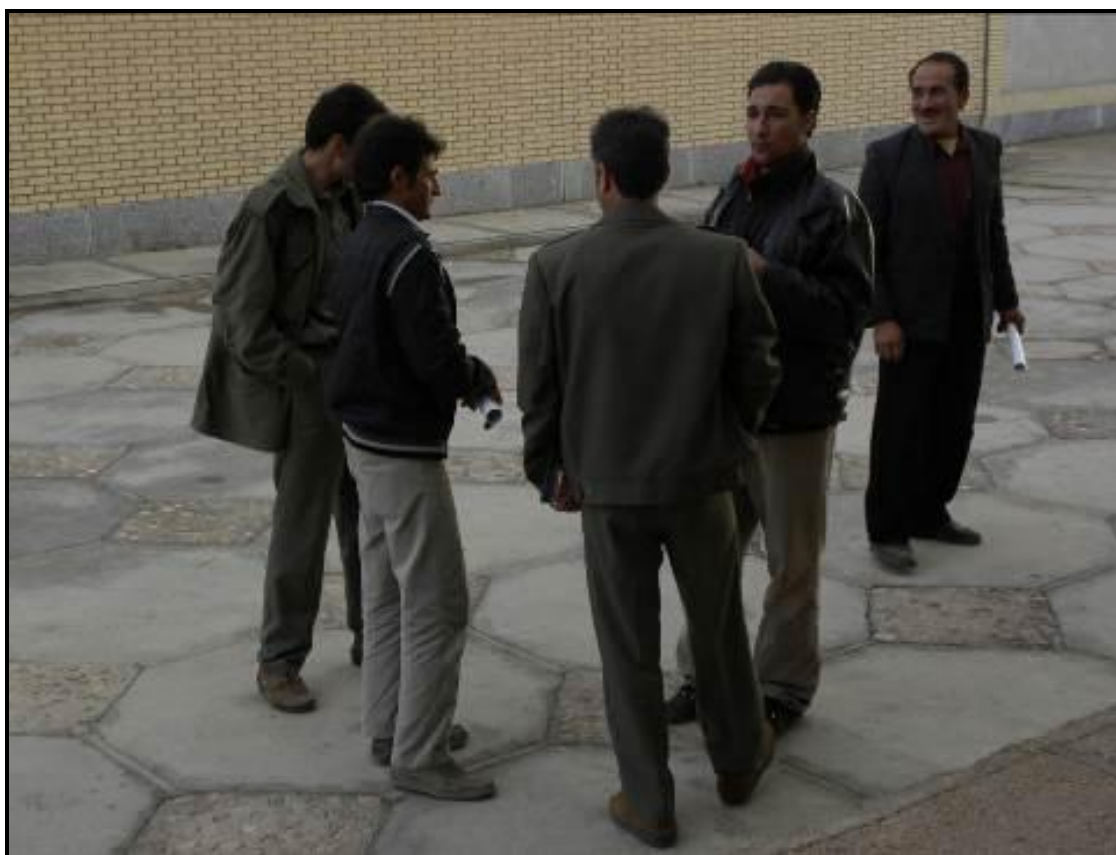
ادامه گفتگوهای مربوط به شکار و طرح قرق اختصاصی پس از پایان برنامه