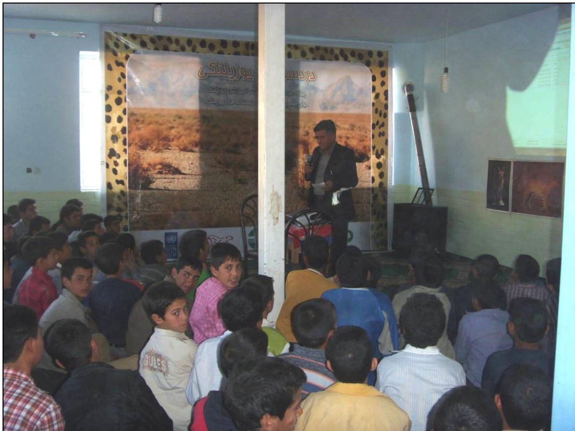
افتتاح رسمی برنامه توسط ریاست شورای اسلامی فراشیان