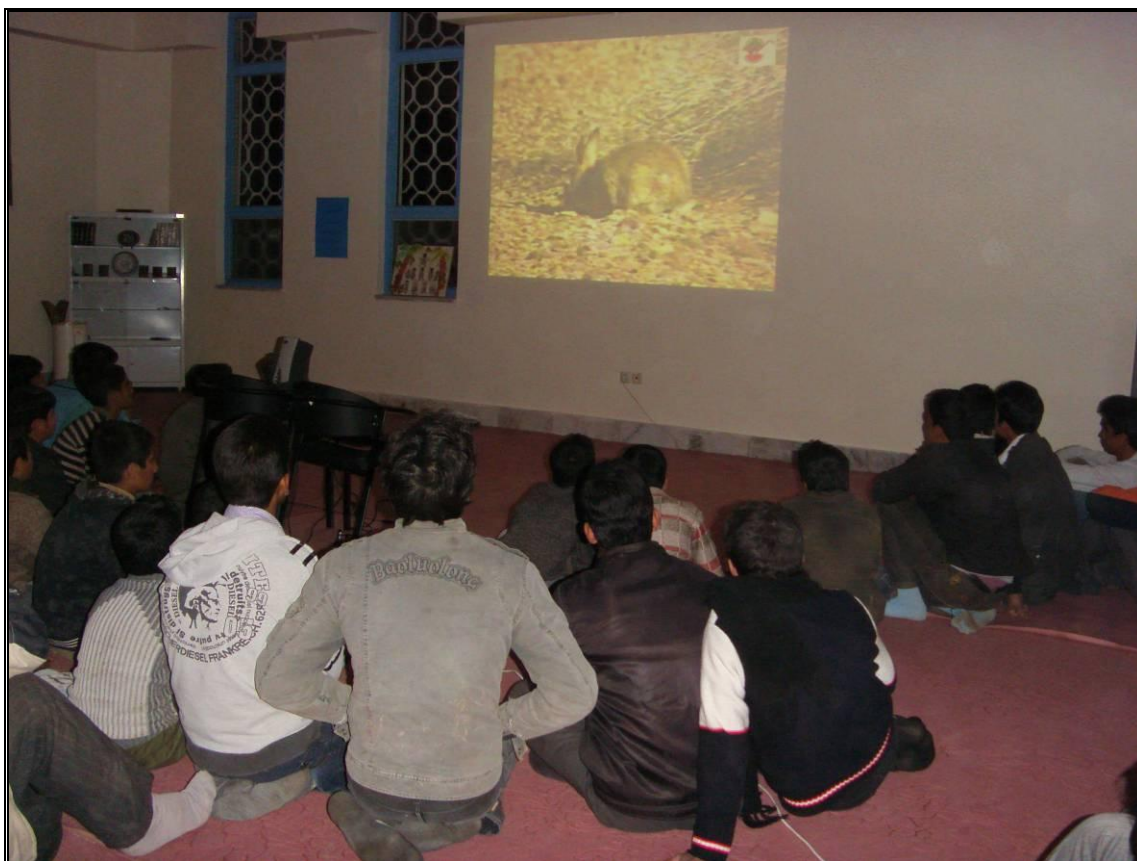
پخش فیلم آشنایی با یوزپلنگ برای مردم