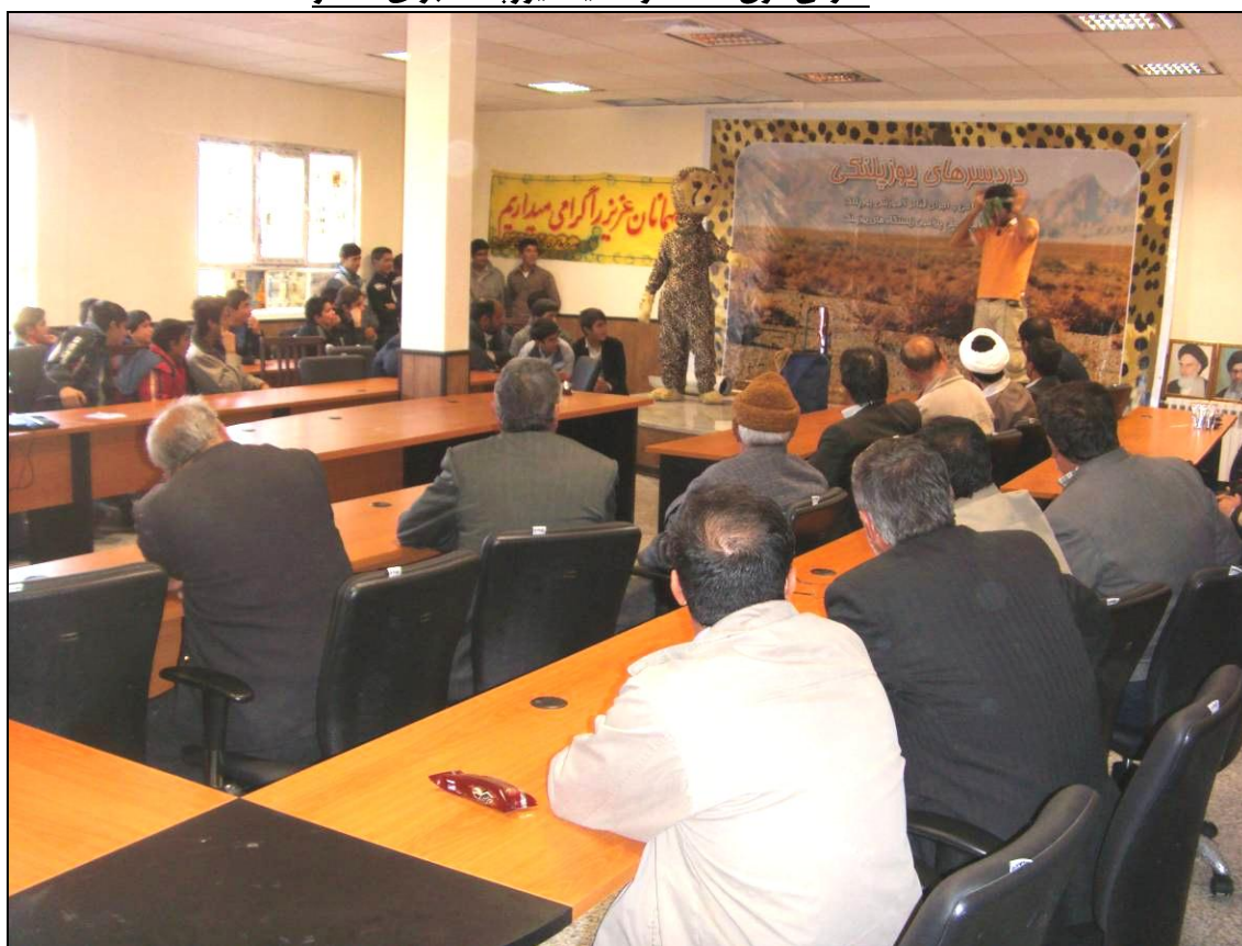
اجرای تئاتر در سالن کنفرانس بخشداری سنخواست