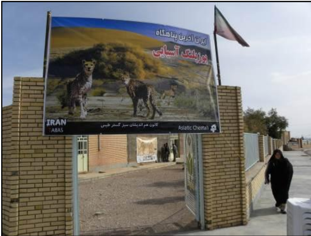
همکاری "کانون هم‌اندیشان سبزگستر طبس" در فضا سازی محل برگزاری برنامه