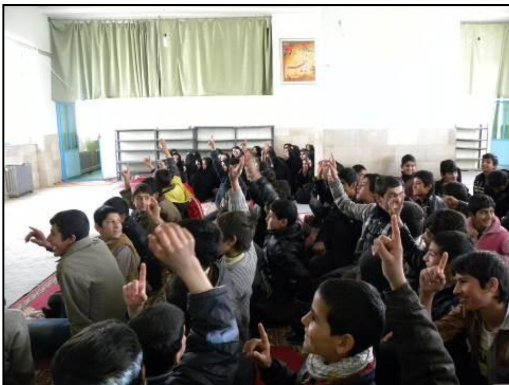
استقبال دانش‌آموزان از برنامه