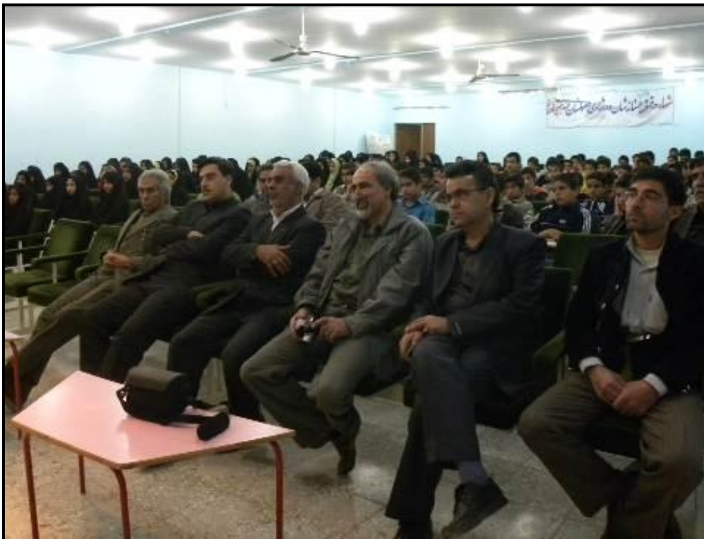
حضور مقامات و مسئولین محلی در برنامه