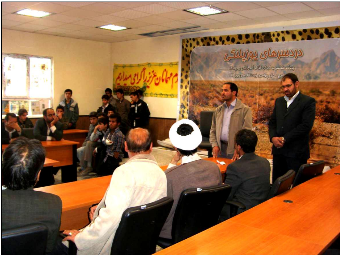
افتتاح رسمی برنامه توسط بخشدار سنخواست و ریاست اداره حفاظت محیط زیست جاجرم