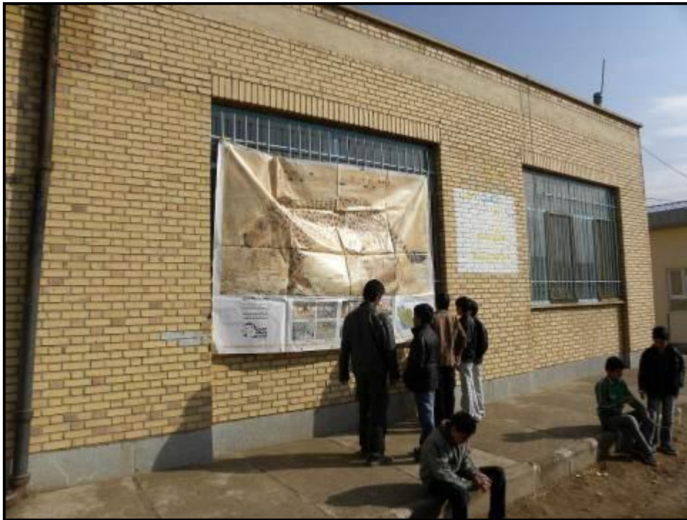
بنر نصب شده در بیرون سالن و توجه دانش‌آموزان به آن