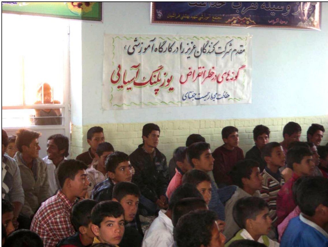
پارچه نویسی اداره حفاظت محیط زیست جغتای