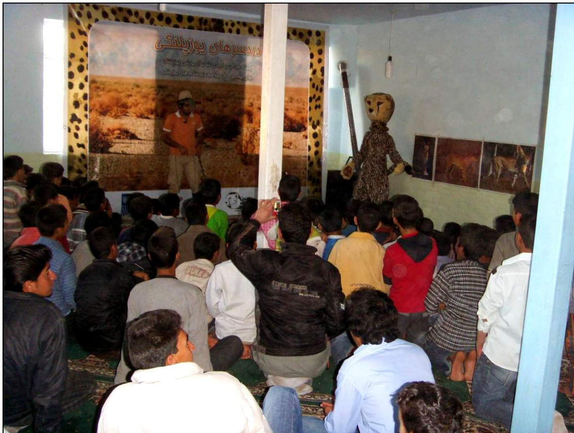
اجرای تئاتر در نمازخانه مدرسه