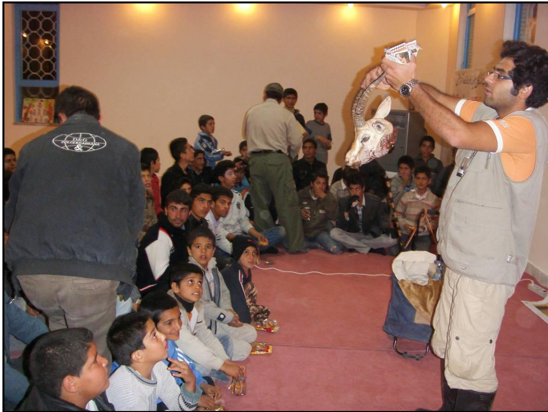
ارائه توضیحات پایانی برای شرکت کنندگان و انجام پذیرایی