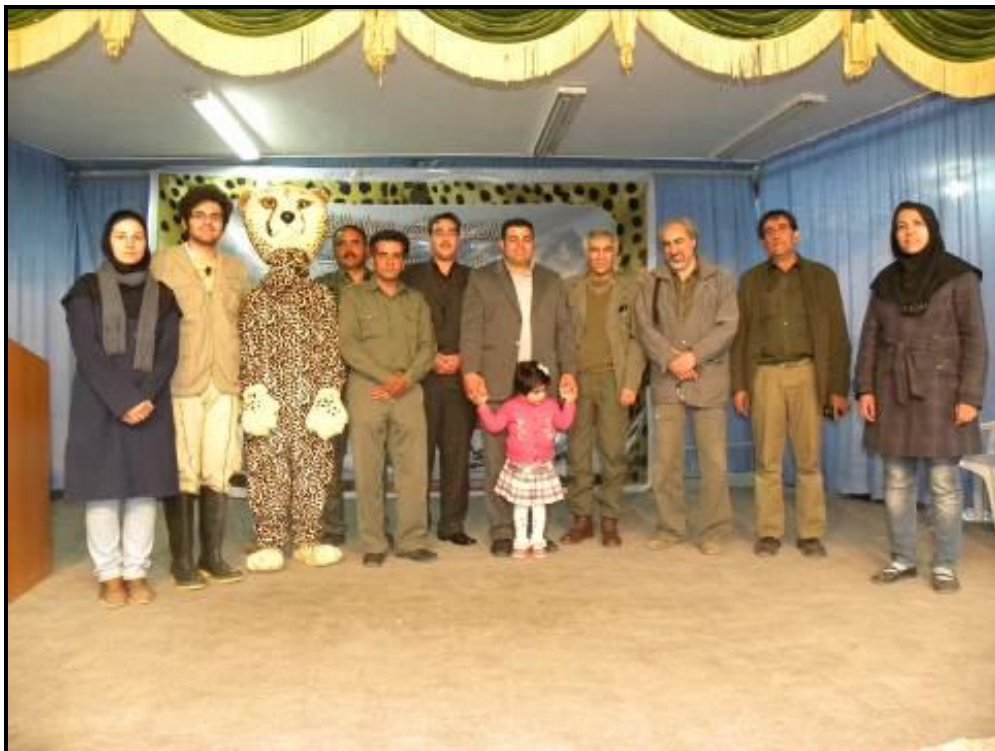
گروه اجرایی برنامه به همراه مسئولین اداره محیط زیست راور و کرمان