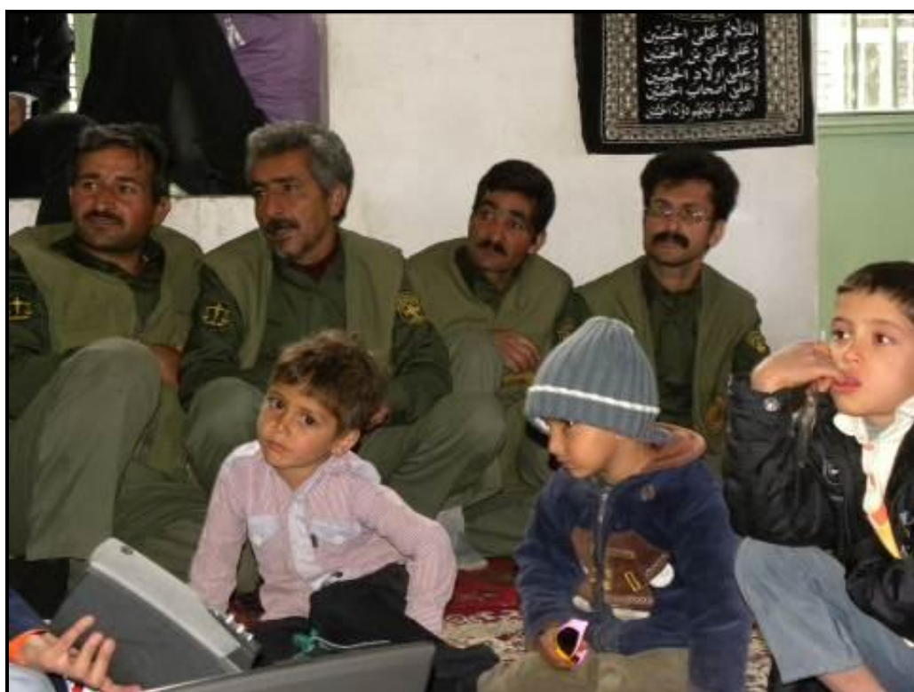
حضور محیط بانان در برنامه