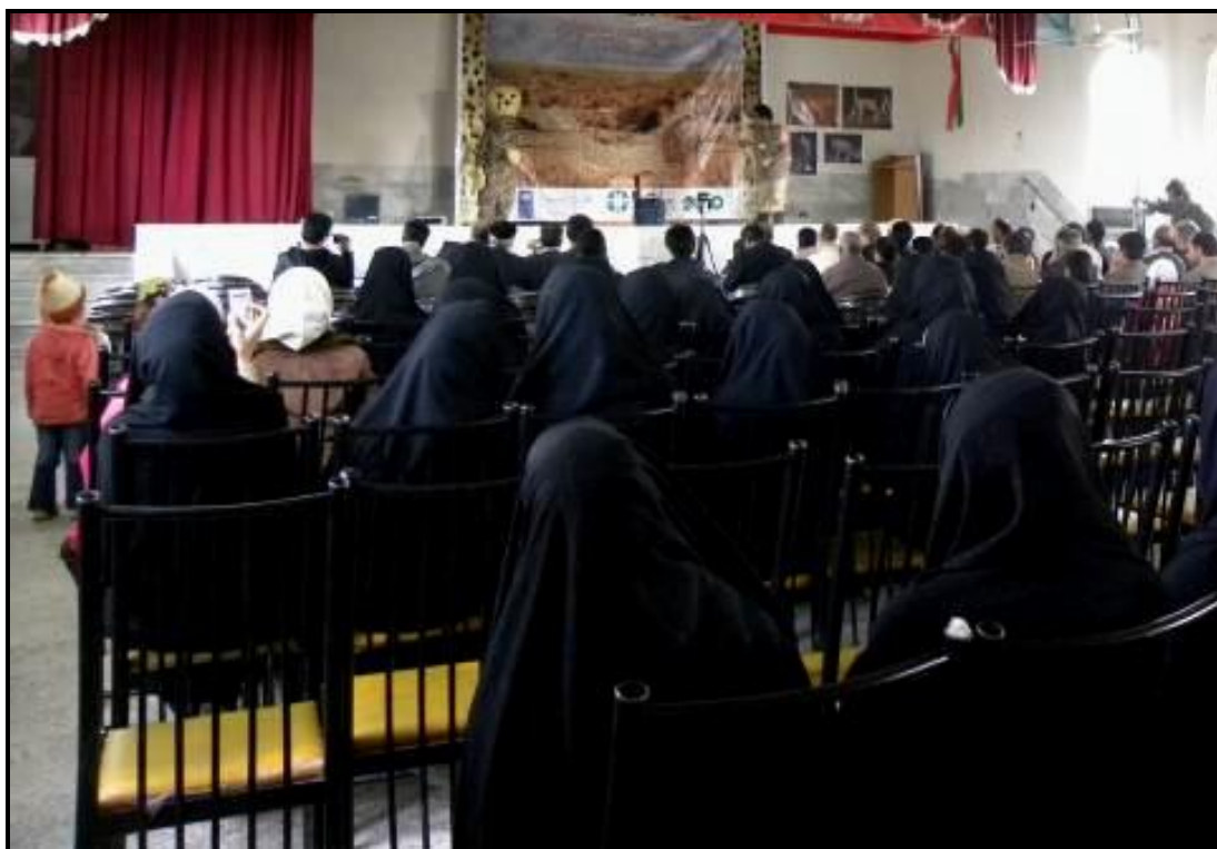
اجرای نمایش در سالن اجتماعات عشق آباد