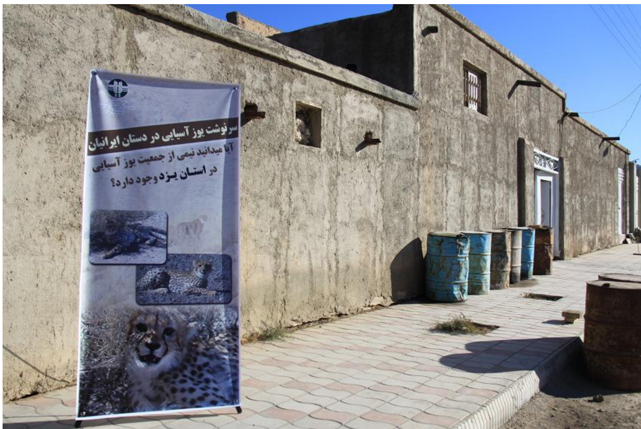
اطلاع رسانی توسط اداره کل حفاظت محیط زیست استان یزد که از چند روز قبل انجام گرفته بود