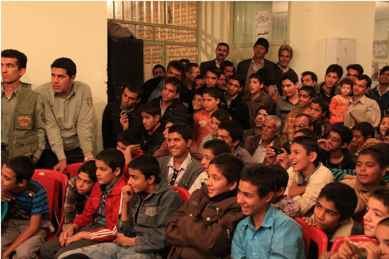
استقبال اهالی چوپانان از برنامه