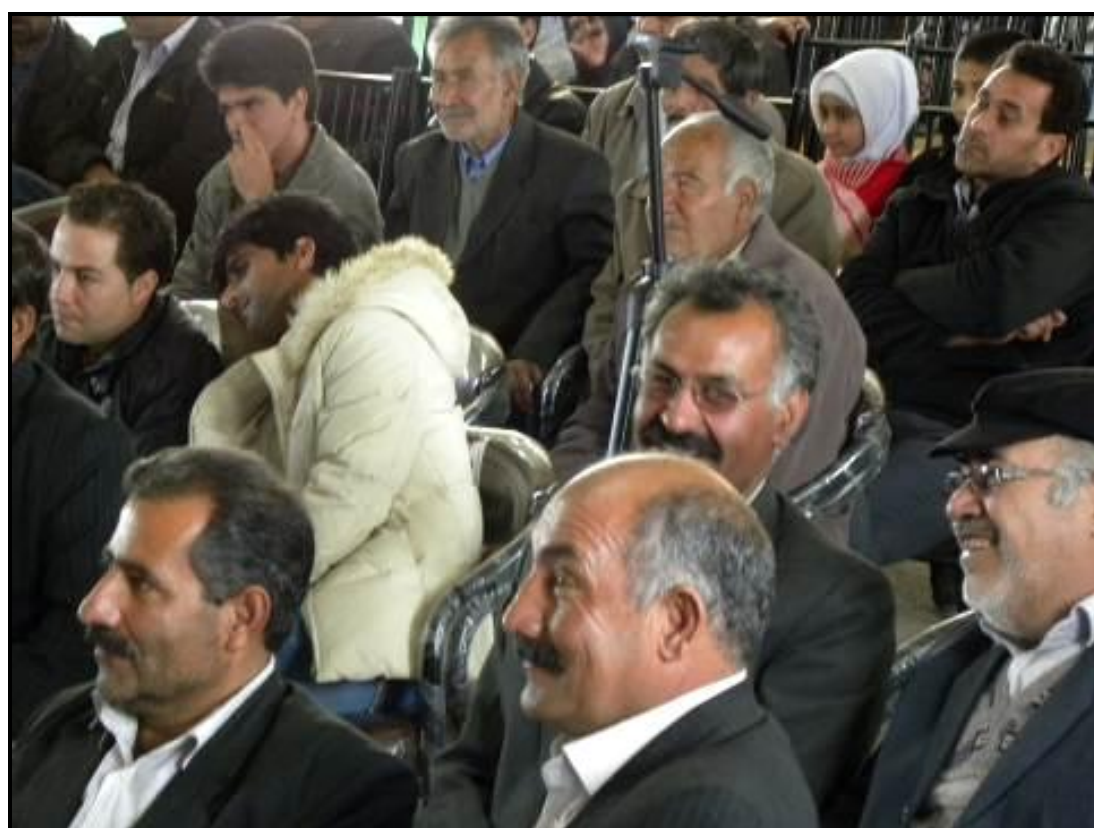
استقبال تماشاگران از اجرای نمایش