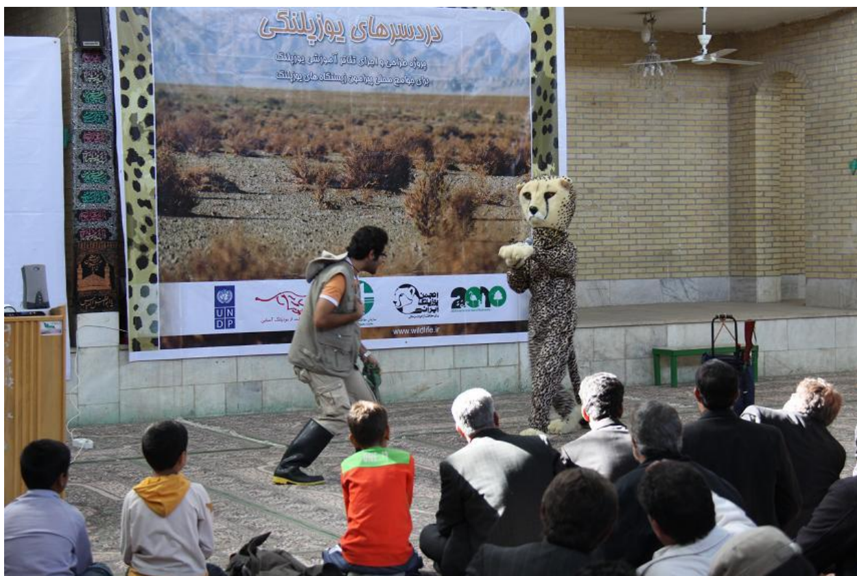
اجرای تئاتر "یوزپلنگ و شکارچی"