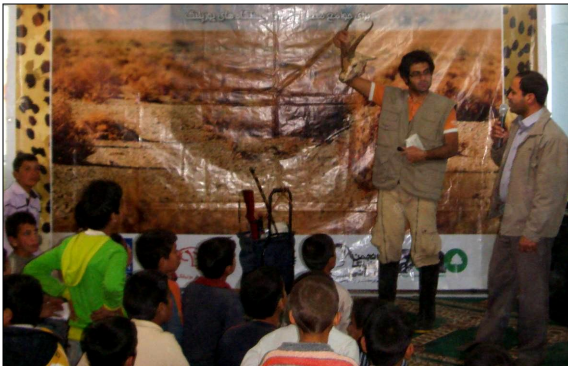
پرسش و پاسخ پایانی و نمایش سر آهوئی که توسط محیط بانان میانداشت از متخلفین گرفته شده است