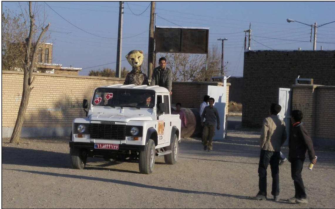
عروسک یوز در روستا سوار بر خودرو گشت زد تا اهالی را جمع نماید