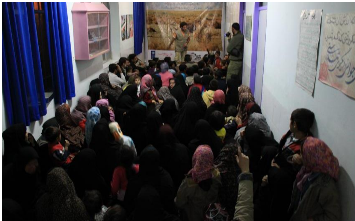
استقبال اهالی خرائق از برنامه