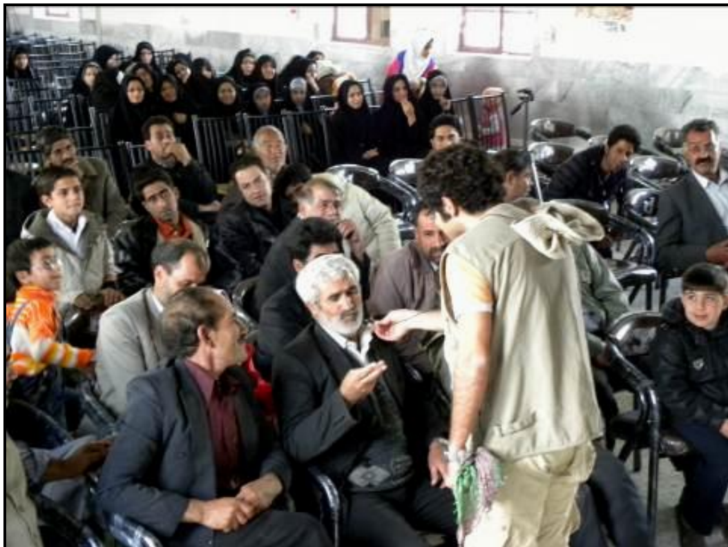
حضور بازیگر نقش شکارچی در میان تماشاگران و پرسش و پاسخ با آنان