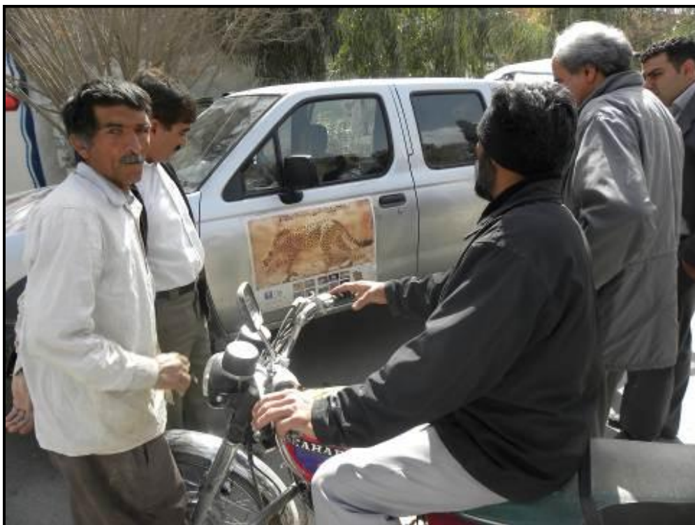
مردم دور پوسترهای نصب شده روی ماشین تجمع کرده و درباره آن سوال و گفتگو می کردند