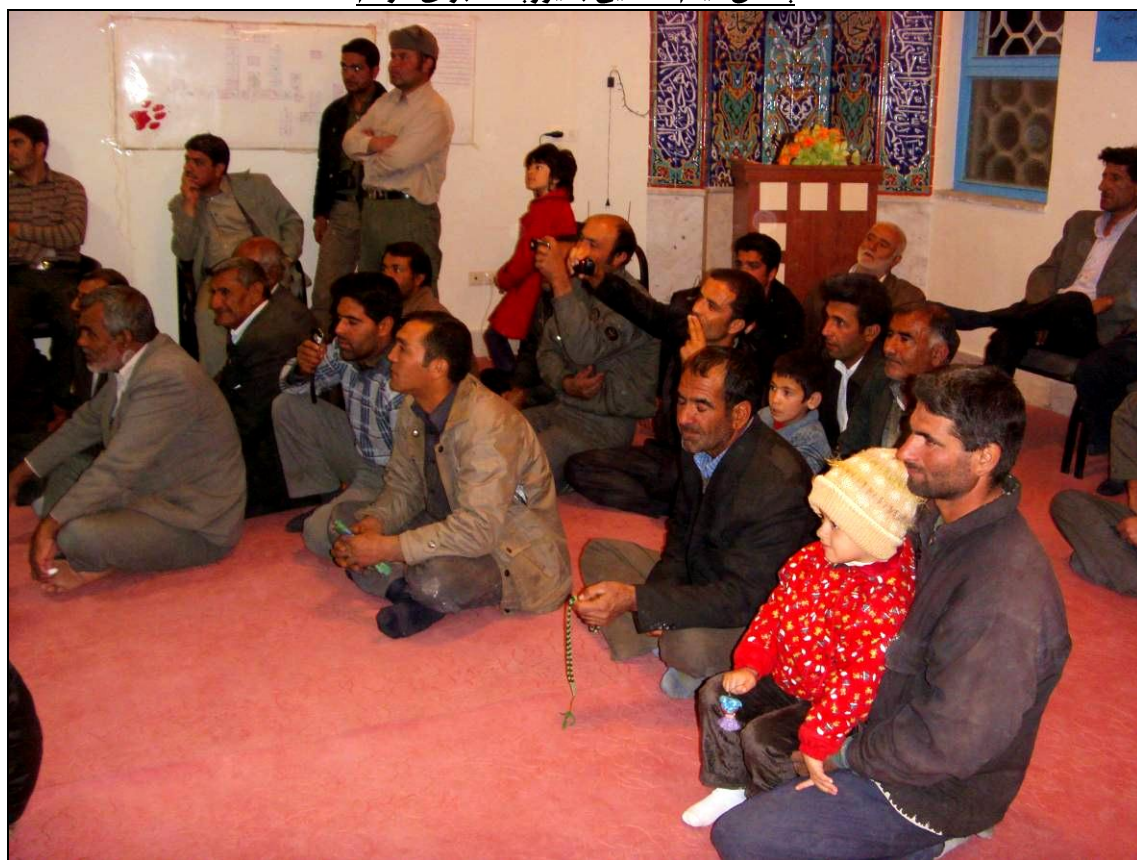
استقبال مناسب دامداران و چوپانان روستا از برنامه