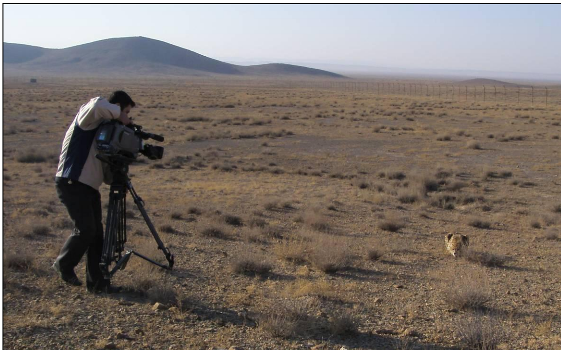
فیلمبرداری از کوشکی توسط گروه اعزامی از صدا و سیما و سیمای سمنان

گروه پس از بازدید از محل نگهداری کوشکی و گشت در منطقه و مشاهده حدود ۵۰ راس آهو، به سمت اداره محیط زیست جاجرم حرکت نمود و پس از تحویل ماشین اداره محیط زیست، به سمت تهران حرکت نمود.