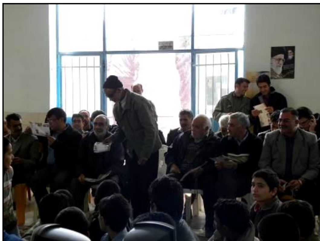
حضور ریش سفیدان در برنامه و توزیع بروشور در میان شرکت کنندگان