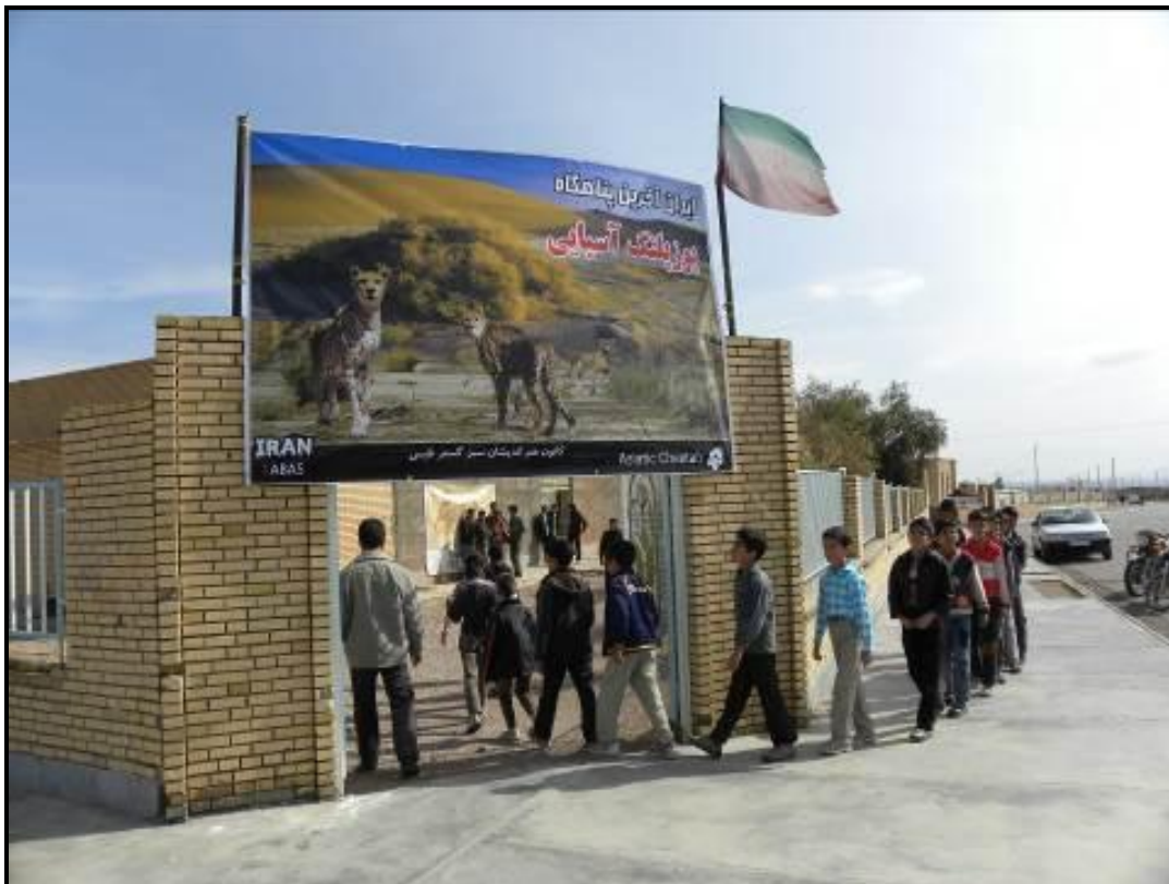
ورود دانش‌آموزان به سالن برگزاری برنامه در دیهوک