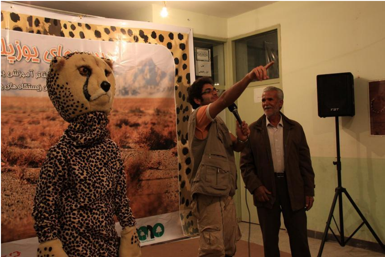
پرسش و پاسخ با شرکت کنندگان