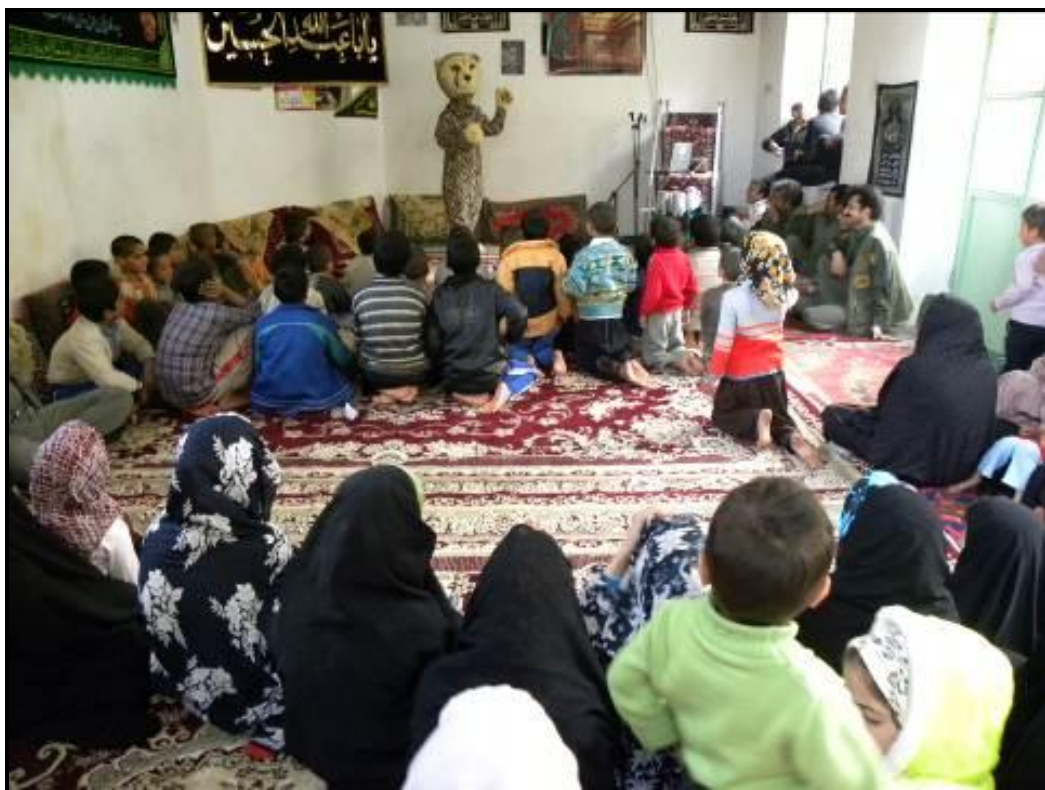
اجرای نمایش در حسینیه روستای نایبند