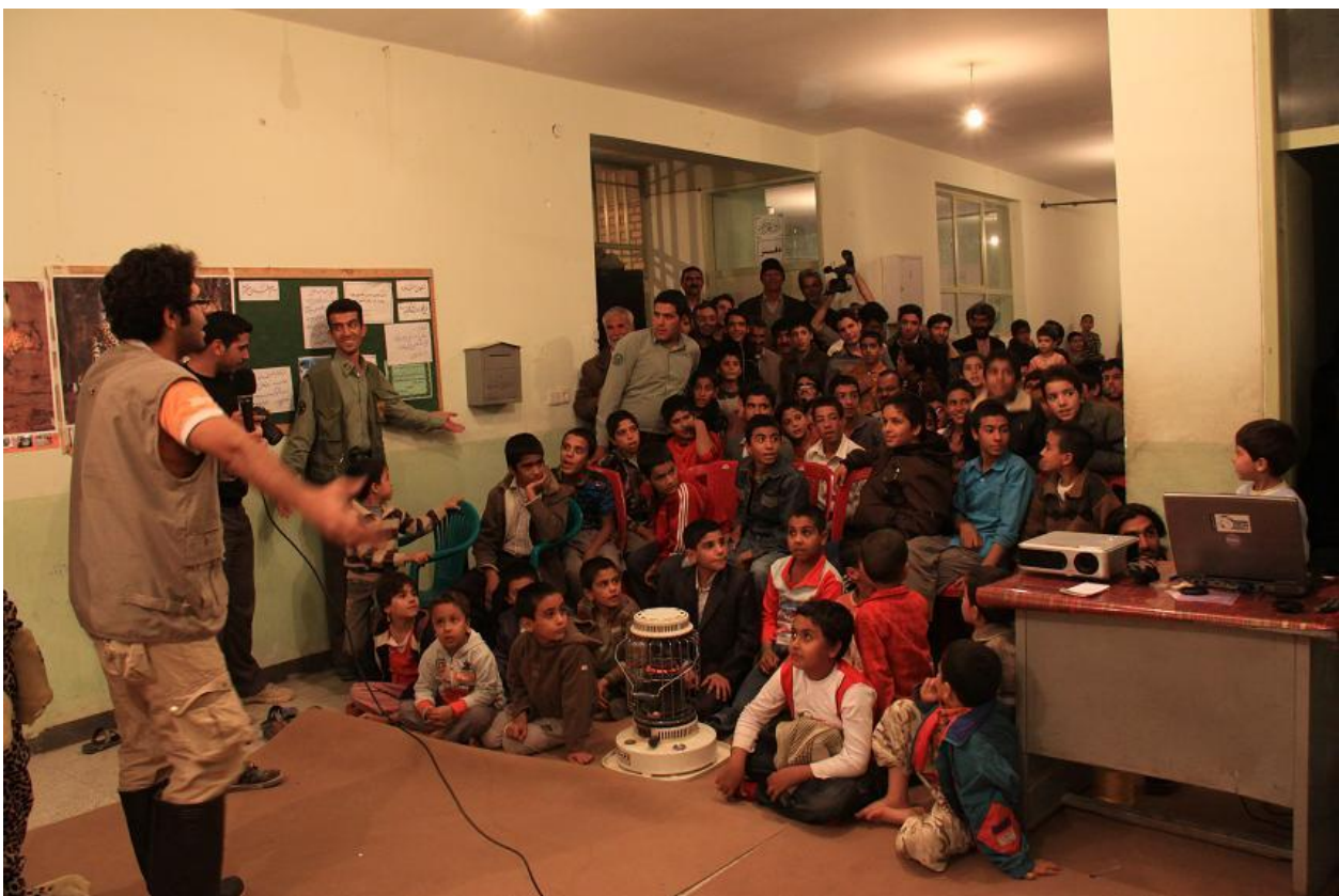
صحبت های بعد از اجرای تئاتر با شرکت کنندگان