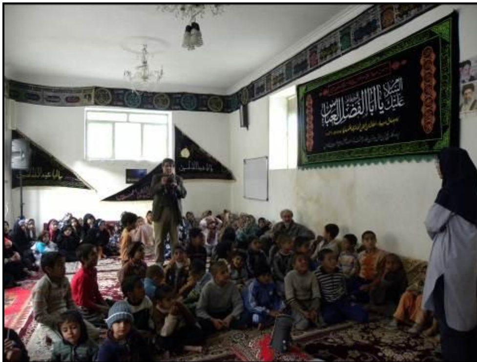
آموزش درباره ویژگی‌های ظاهری و رفتاری یوزپلنگ