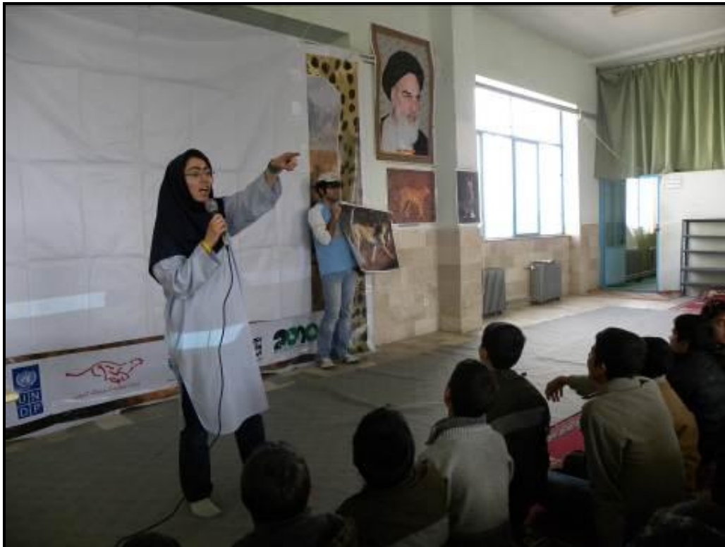
آموزش درباره ویژگی‌های ظاهری و رفتاری یوزپلنگ