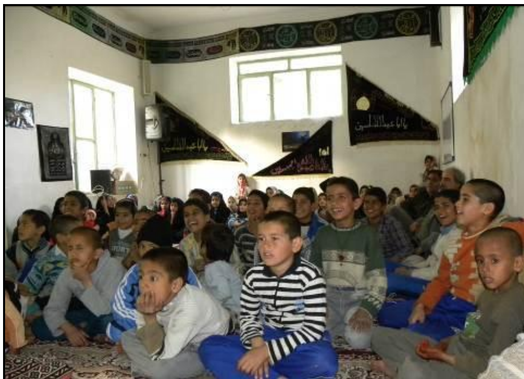
استقبال کودکان و نوجوانان از کلیپ‌های آموزشی