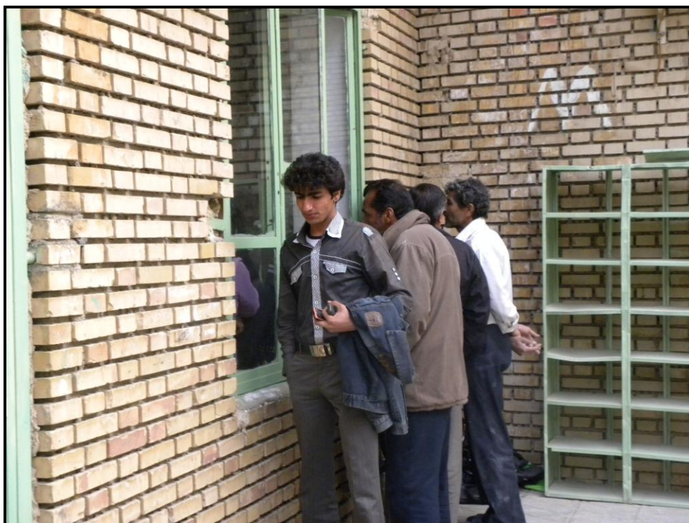
حضور بزرگسالان روستای نایبند برای دیدن برنامه