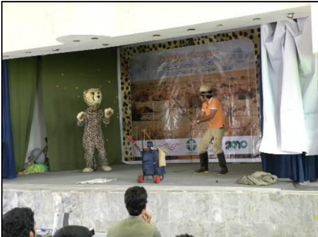
اجرای نمایش در سالن آموزش و پرورش دیهوک