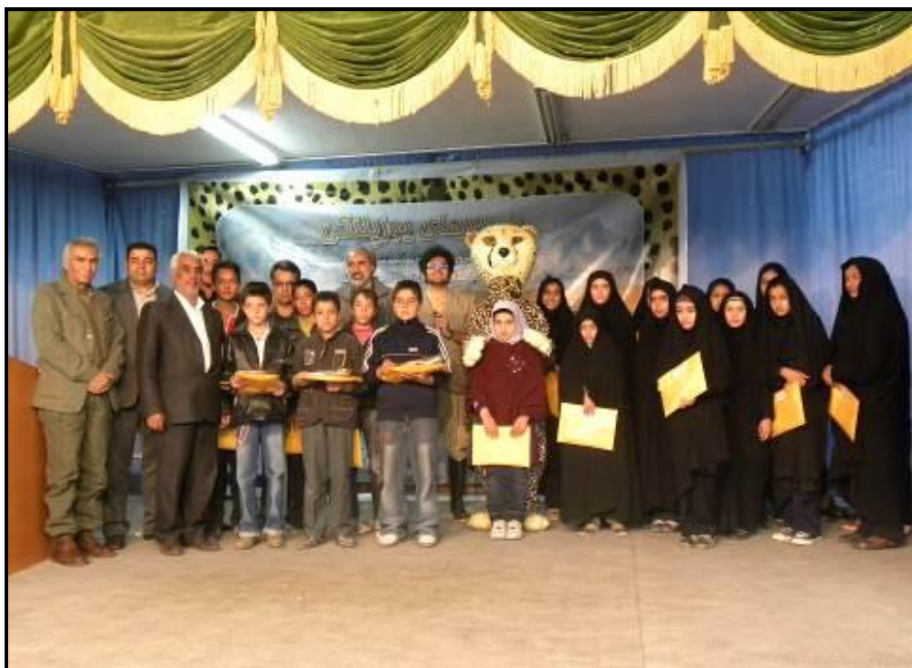
اهدای جوایز به دانش آموزان برای کشیدن نقاشی و ساخت کلیپ با موضوع یوزپلنگ