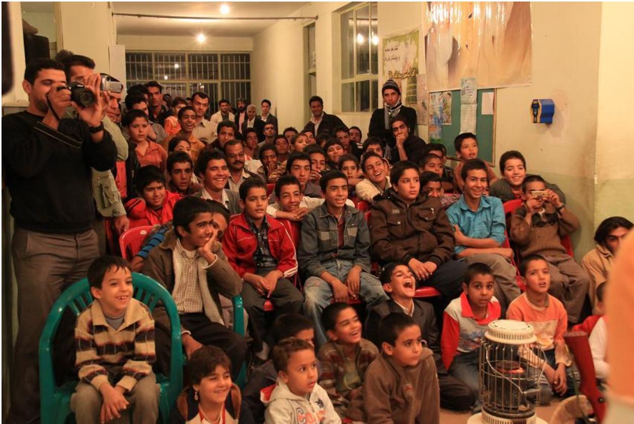
استقبال اهالی چوپانان از برنامه