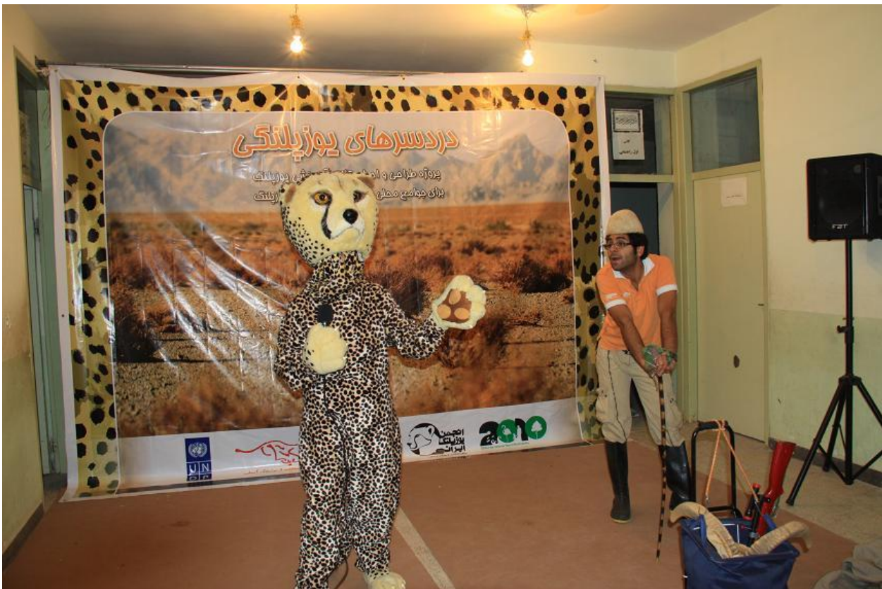
اجرای تئاتر دردسره‌های یوزپلنگی