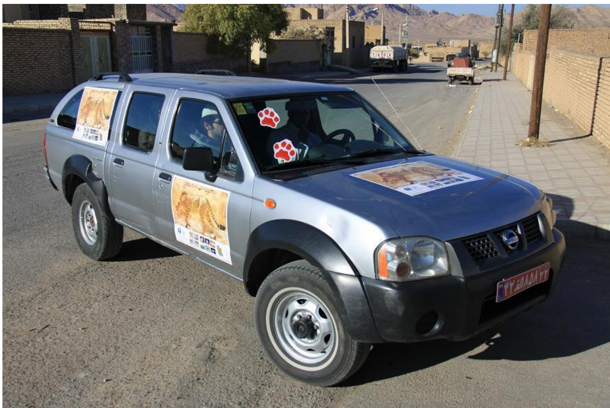
تزئین خودروی در اختیار گروه