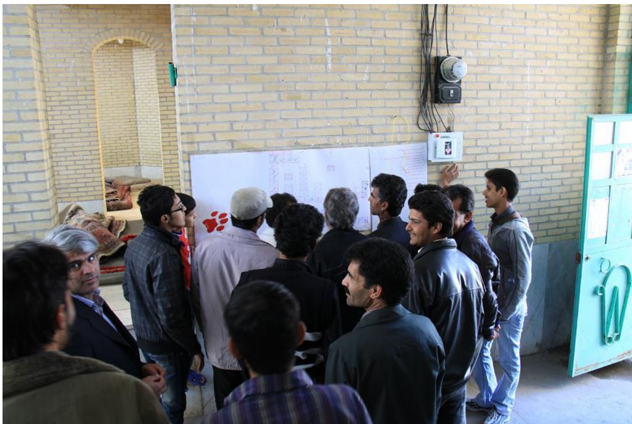
حل "جدول یوزپلنگ" توسط اهالی پیش از شروع برنامه