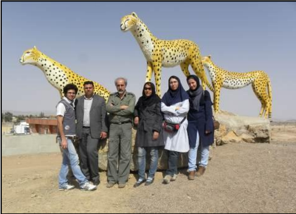
گروه اجرایی از مجسمه‌های یوزپلنگ نصب شده در شهر راور بازدید کرد