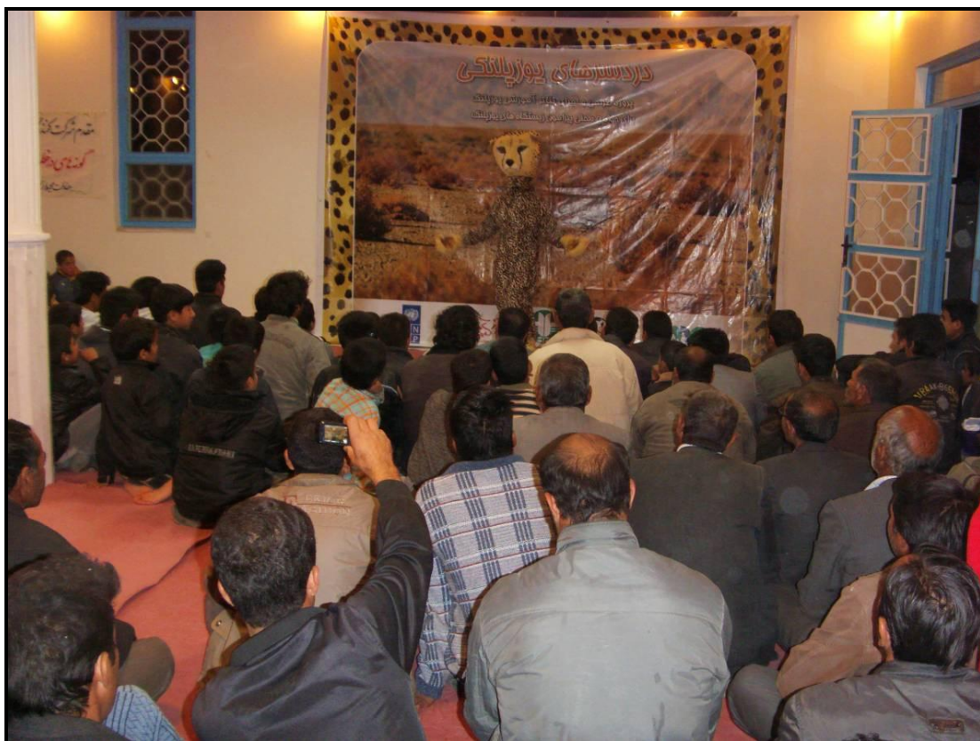
اجرای نمایش در محل سالن نمازخانه