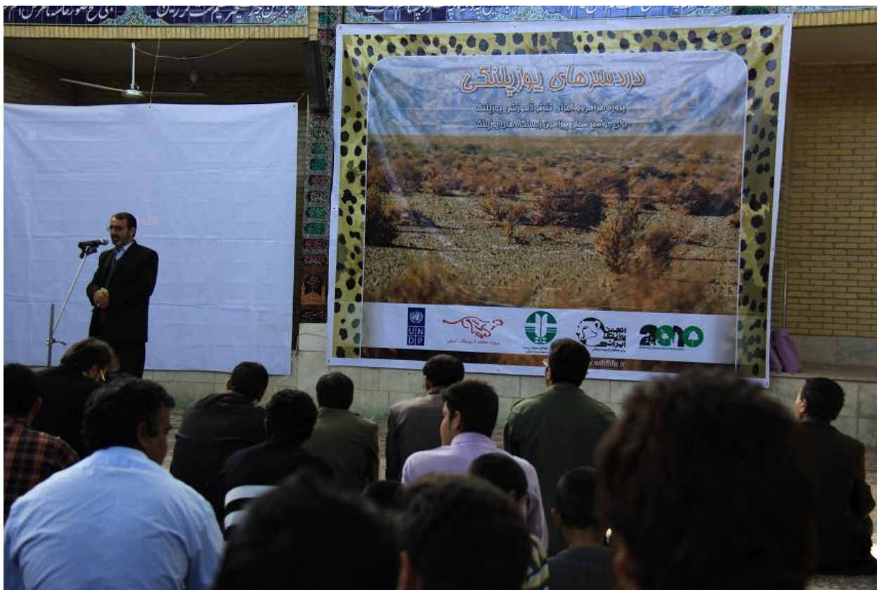
صحبت های آقای شاکر