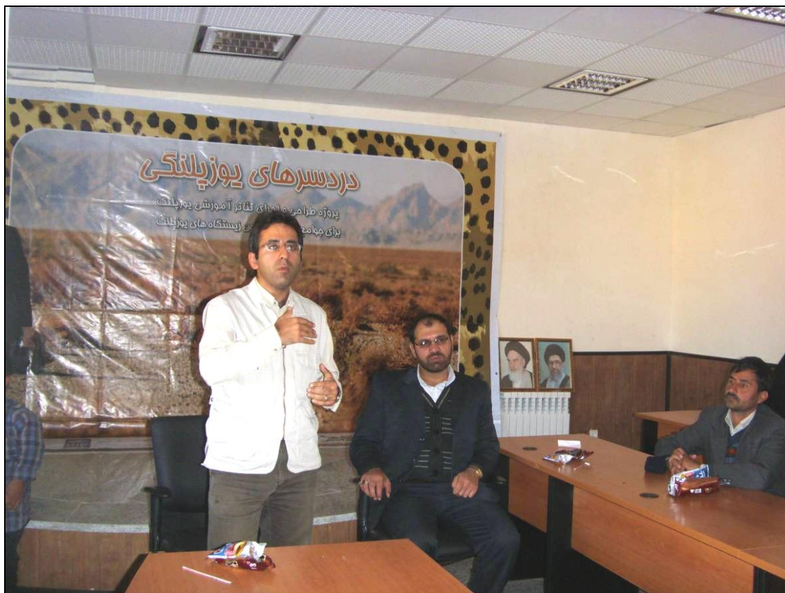
معرفی فون منطقه و اهمیت یوزپلنگ برای حضار