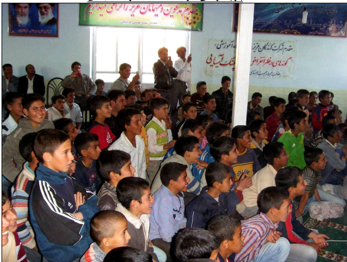
شرکت کنندگان علاقمند به تئاتر یوزپلنگ