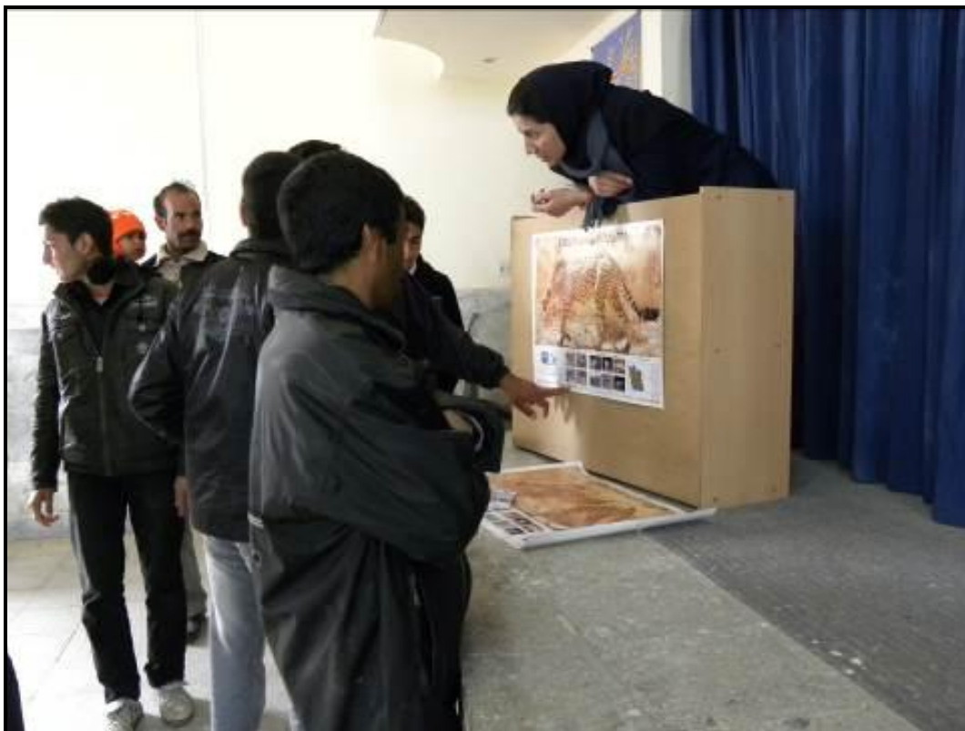
گفتگوهای آموزشی شکل گرفته در کنار پوستر یوزپلنگ پیش از شروع برنامه