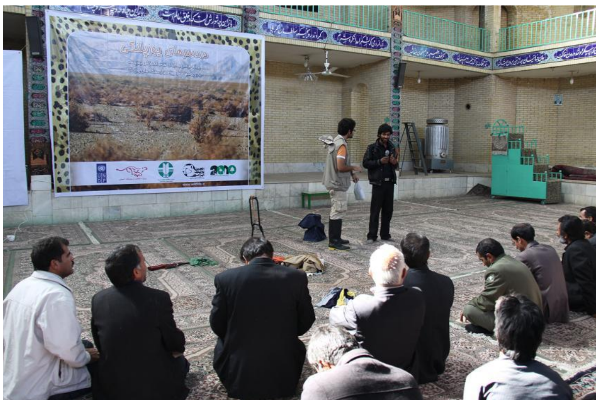
یکی از جوانان توضیح می دهد که ۳ سال است که شکار را کنار گذاشته و آماده همکاری با محیط زیست است