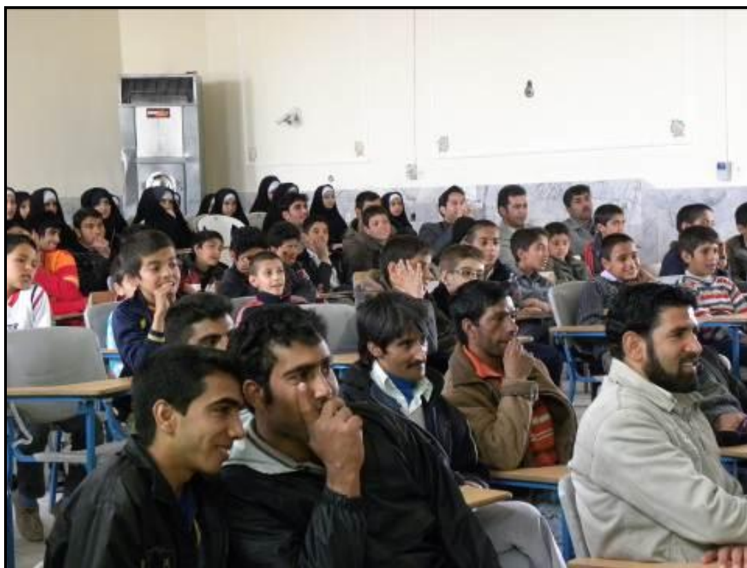
استقبال بزرگسالان و نوجوانان از برنامه