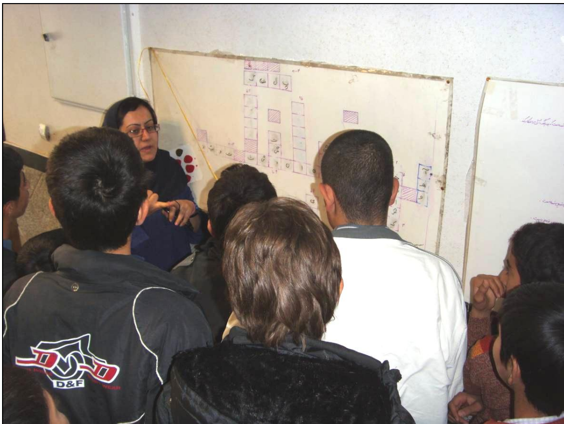
جدول یوزپلنگ برای دانش آموزان