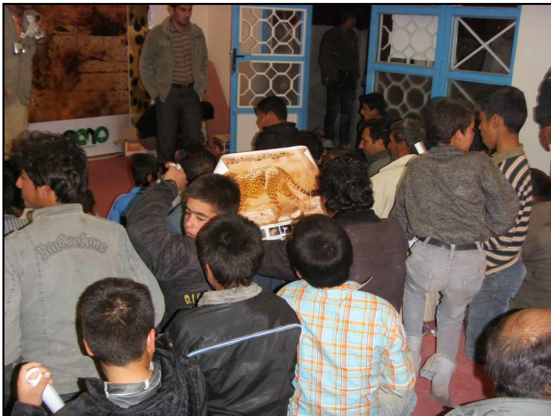
توزیع پوستر و بروشور در میان شرکت کنندگان در پایان مراسم