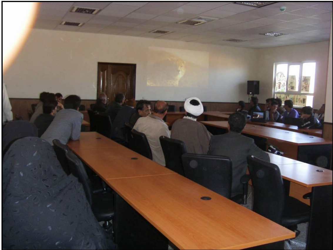
بخش فیلم یوزپلنگ برای حضار