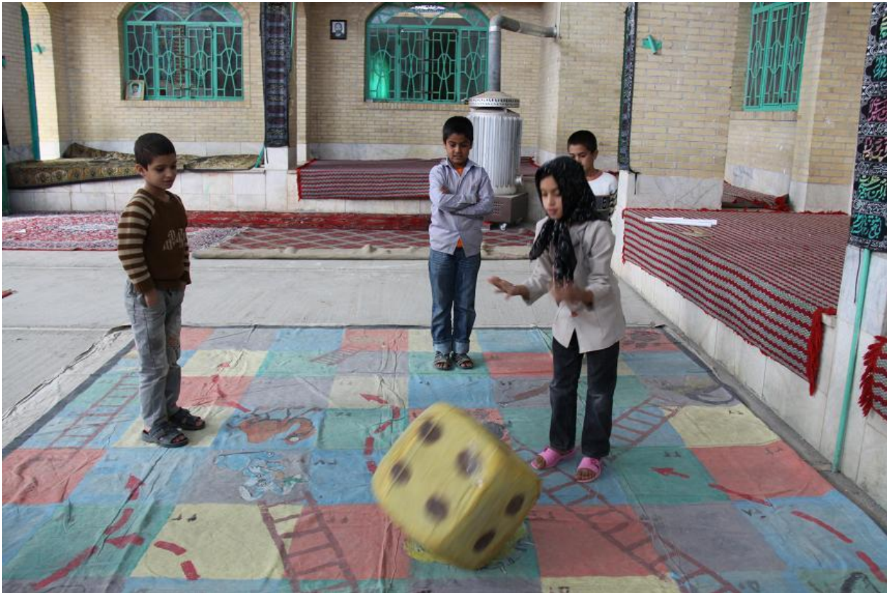
کودکان در حال بازی "یوز و پله"