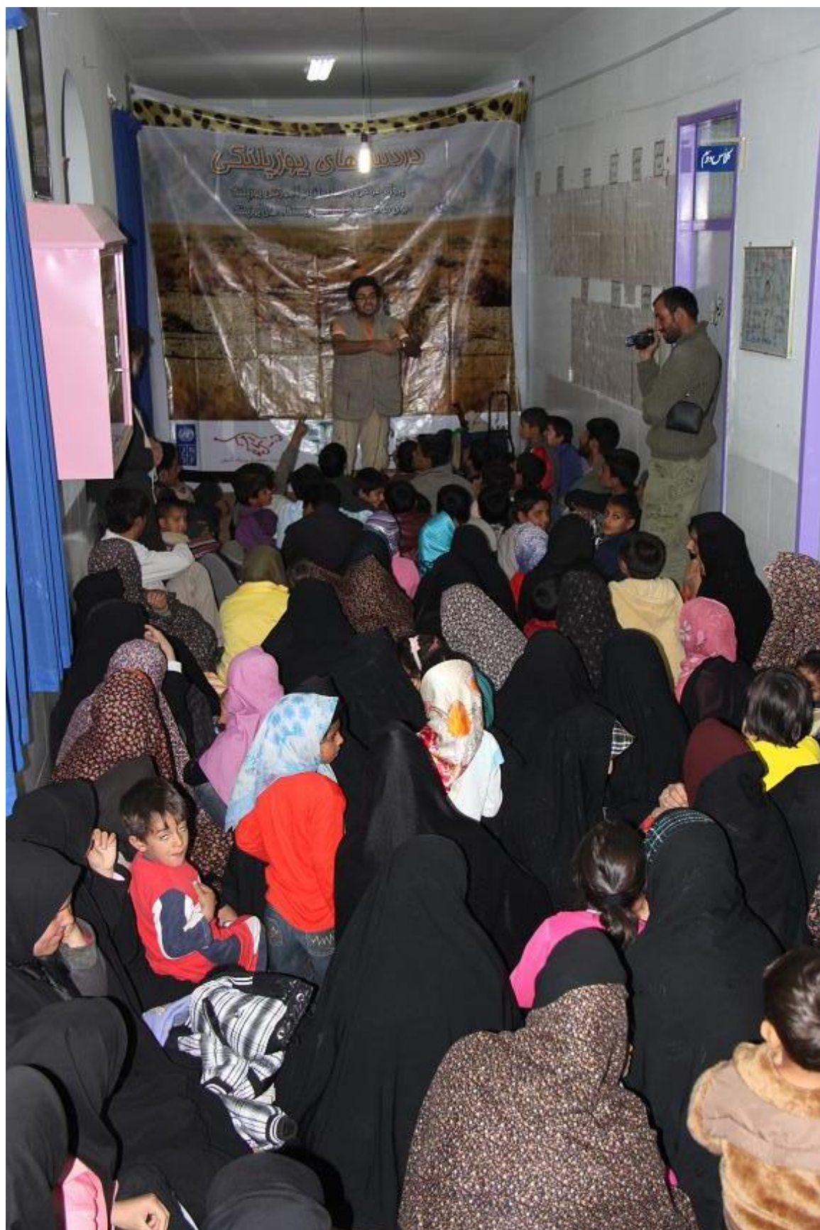
پرسش و پاسخ پس از اجرای تئاتر