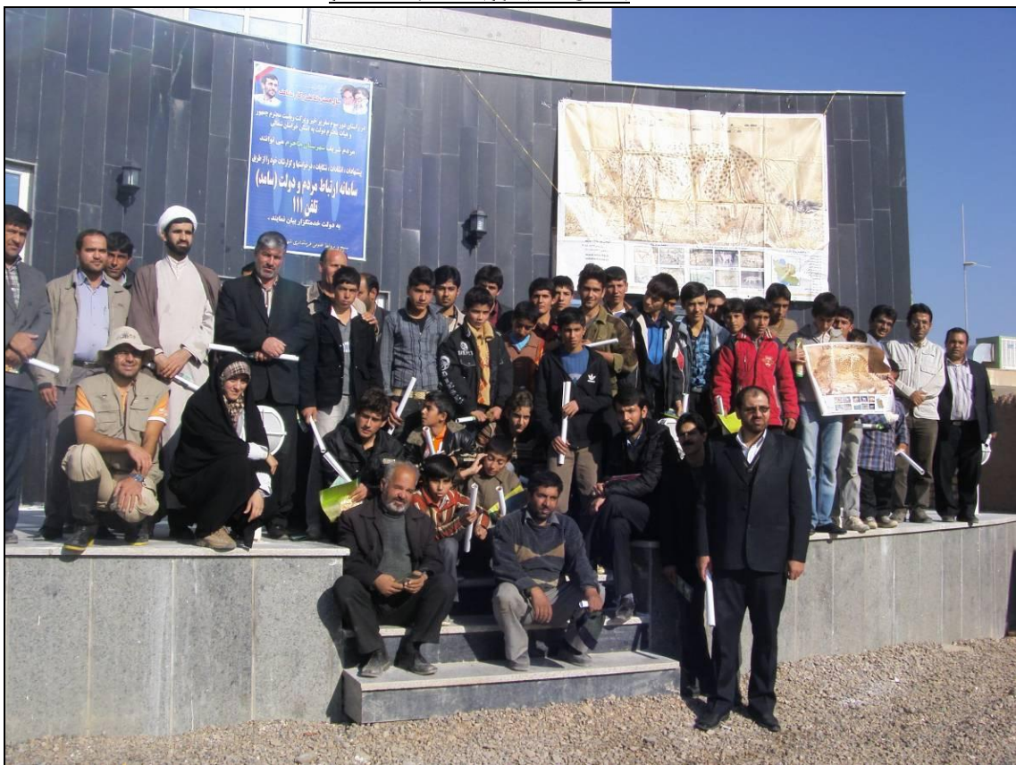
عکس پایانی با حضور مقامات و مردم سنخواست