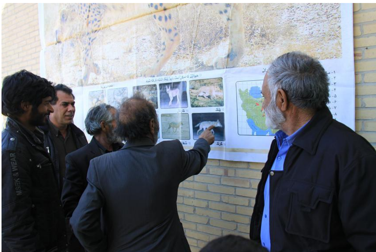
توجه اهالی به تصاویر بنرهای نصب شده و بحث در مورد آنها