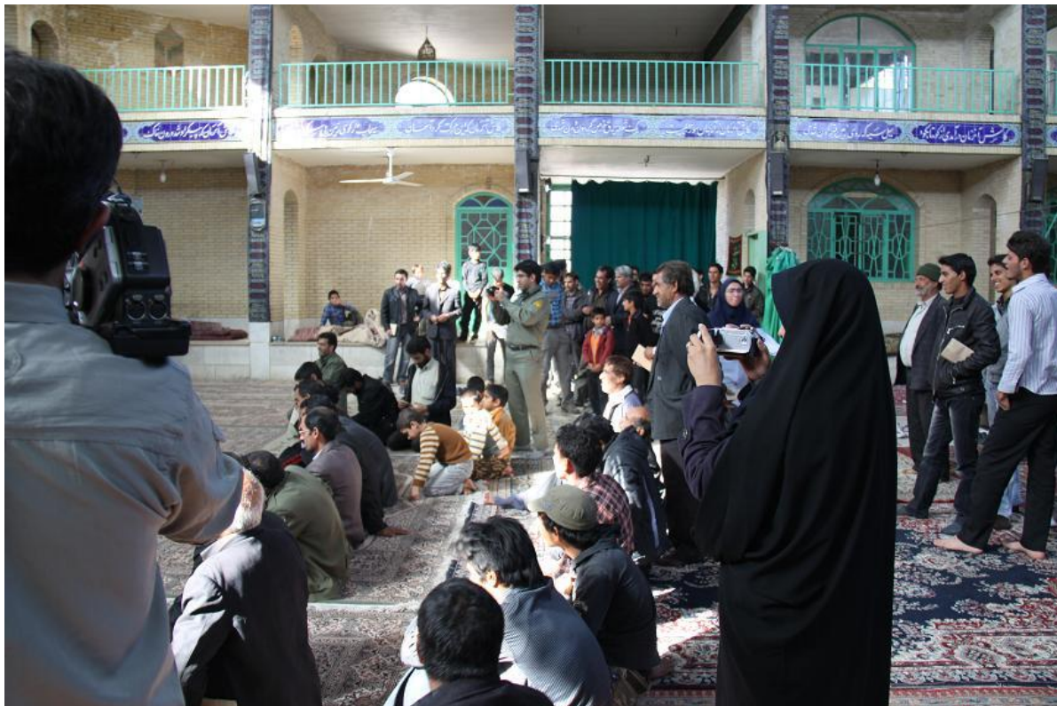
استقبال حاضرین از تئاتر