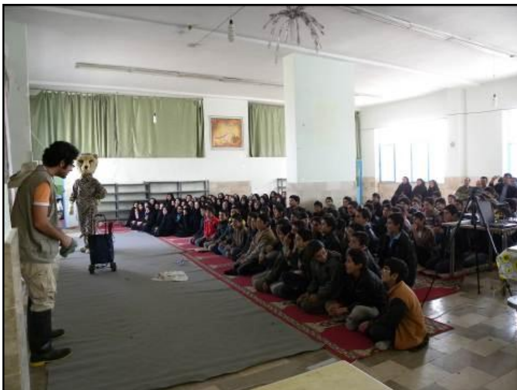
اجرای نمایش در سالن غذاخوری مدرسه شبانه روزی پسرانه زمان آباد