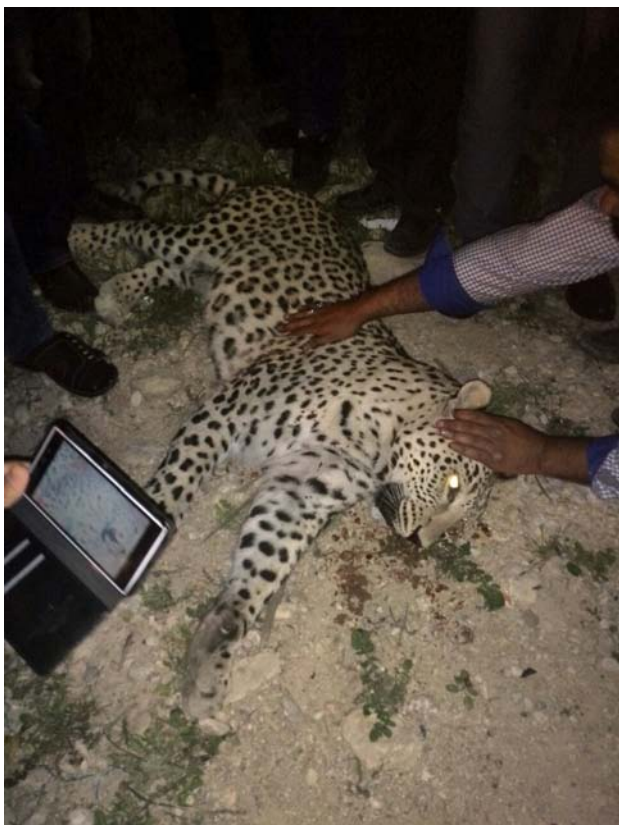
شکل ۷) یک پلنگ نر بالغ در منطقه کوه قبله استان فارس در جاده شیراز کازرون در بهار ۱۳۹۴، جان خود را از دست داد.