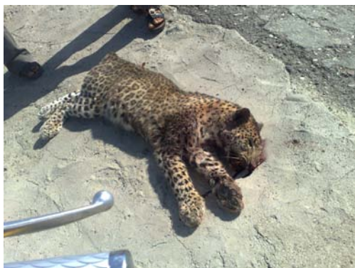
شکل ۳) یک پلنگ بالغ جوان در سال ۱۳۸۸ بخاطر برخورد با خودرو عبوری در جاسک هرمزگان جان خود را از دست داد.