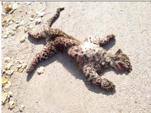
شکل ۲) توله پلنگ بی چاره که به اندازه یک گربه است، متأسفانه در جاده پارک ملی گلستان در سال ۱۳۸۷ بخاطر برخورد با خودرو کاملاً له شده است.