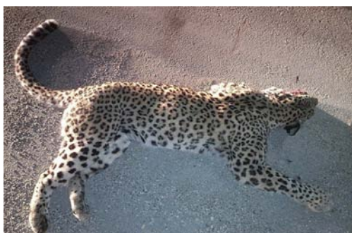
شکل ۴) در بهار ۱۳۹۳، یک پلنگ مادر در منطقه آدم چاقران در پارک ملی گلستان بخاطر تصادف با خودرو جان خود را از دست داد.