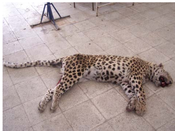
شکل ۵) در سال ۱۳۸۹، یک پلنگ نر بالغ بخاطر تصادف با تریلی در نمرود فیروزکوه جان خود را از دست می‌دهد. صورت پلنگ در این تصادف کاملاً له شده بود و پوست سر جانور نیز بخاطر کشیده شدن روی زمین در زمان تصادف، کاملاً از بین رفته بود.

«پارک ملی گلستان» یکی از بهترین زیستگاه‌های پلنگ در ایران است. براساس سرشماری انجام گرفته در «پارک ملی گلستان» تعداد ۲۳ تا ۴۲ فرد پلنگ در این منطقه شناسایی شدند. بنابراین، «پارک ملی گلستان» بیشترین جمعیت پلنگ را در میان مناطق حفاظت شده ایران دارد. همچنین، یکی از بیشترین آمار مشاهده پلنگ و ثبت عکس و فیلم مربوط به «پارک ملی تندوره» در استان خراسان رضوی است. در «پارک ملی تندوره» توانستند ۴ پلنگ را برای نصب گردن بند ماهواره‌ای زنده‌گیری کنند. در «پارک ملی و پناهگاه حیات وحش خبر و روچون» در استان کرمان نیز مشاهده پلنگ زیاد است. البته، «پارک ملی بمو» استان فارس نیز که در ناحیه‌ای بین شمال شیراز و مرودشت قرار گرفته، یکی از زیستگاه‌هایی است که آمار مشاهدات پلنگ بالاست اما جمعیت پلنگ آن کمتر از این سه منطقه است. بزرگترین زیستگاه حفاظت شده پلنگ در ایران، «منطقه حفاظت شده، پناهگاه حیات وحش و پارک ملی توران» در استان سمنان است. منطقه توران یک میلیون و چهارصد هزار هکتار وسعت دارد.