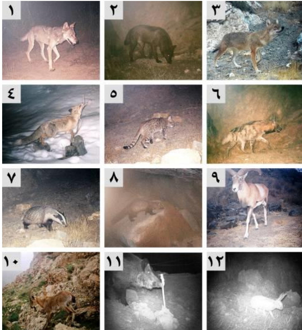
شکل ۲: نمونه‌هایی از تصاویر گرفته‌شده توسط دوربین‌های تله‌ای از تنوع گونه‌ای پستانداران در پناهگاه حیات وحش انگوران، استان زنجان (بهمن ۱۳۸۸ - اردیبهشت ۱۳۹۰)

بالا از چپ به راست: (۱) گرگ خاکستری ( Canis lupus )، (۲) ریخت ملانیستیک گرگ خاکستری، (۳) شغال ( Canis aureus )، (۴) روباه معمولی ( Vulpes vulpes )، (۵) گربه وحشی ( Felis silvestris )، (۶) کفتار راه‌راه ( Hyaena hyaena )، (۷) رودک معمولی ( Meles meles )، (۸) سمور سنگی ( Martes foina )، (۹) گوسفند وحشی ( Ovis orientalis )، (۱۰) بز و پازن ( Capra aegagrus )، (۱۱) گراز ( Sus scrofa )، (۱۲) خرگوش ( Lepus spp. ) عکس‌های (۴) و (۱۱) تنها نشانه از واکنش گونه‌های مورد اشاره به جاذب شیمیایی به‌کار رفته در این مطالعه بود.